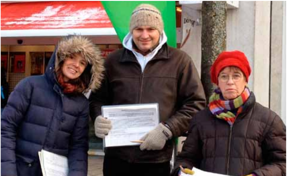
War die Sammlung von Unterschriften erfolgreich? Die Gesichter der fleißigen Sammler des OV Berg am Lain lassen sich in mehrerlei Hinsicht deuten ...