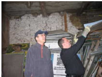
Bisheriges Lager in Brannenburg

Für die Lagerung unserer Plakatständer suchen wir ab sofort und für längerfristig bis zu drei Garagen zur Miete oder zum Kauf. Alternativ auch leerstehende Scheunen, Schuppen oder ähnliches. Die Räumlichkeiten sollten sich innerhalb des Münchner S-Bahn-Netzes befinden. Weitere Bedingungen: ebenerdig, abschließbar, keine Tiefgarage, kein Duplex, gut mit Transporter erreichbar, problemloses Ein- und Ausladen der Plakatständer. Angebote bitte an das Stadtbüro mailen.